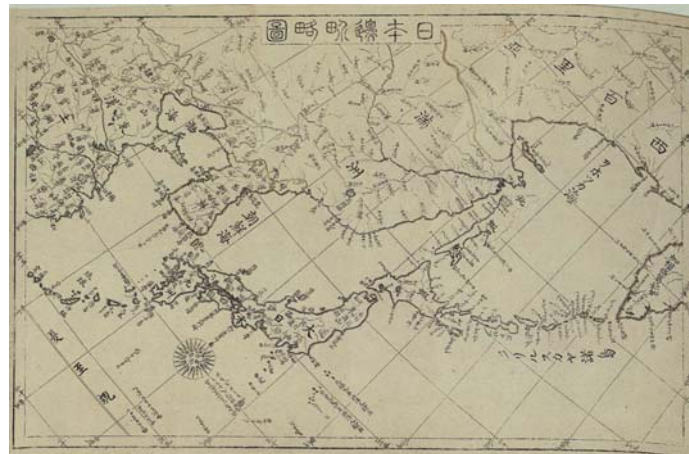
그림 1 1809년 천문관 고교경보(高橋景保)가 왕명을 받들어 제작한 일본변계약도(日本邊界略圖)

특히 1809년에 천문관이었던 고교경보(高橋景保)는 왕명을 받들어 공식지도인 일본변계약도(日本邊界略圖)를 제작하였는데 그는 이 지도에서 일본해 대신 분명히 조선해(朝鮮海)라고 표기하였다.