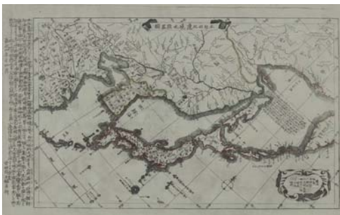
그림 4 1850년 안전뇌주(安田雷州)가 만든 본방서북변계약도(本邦西北邊界略圖)