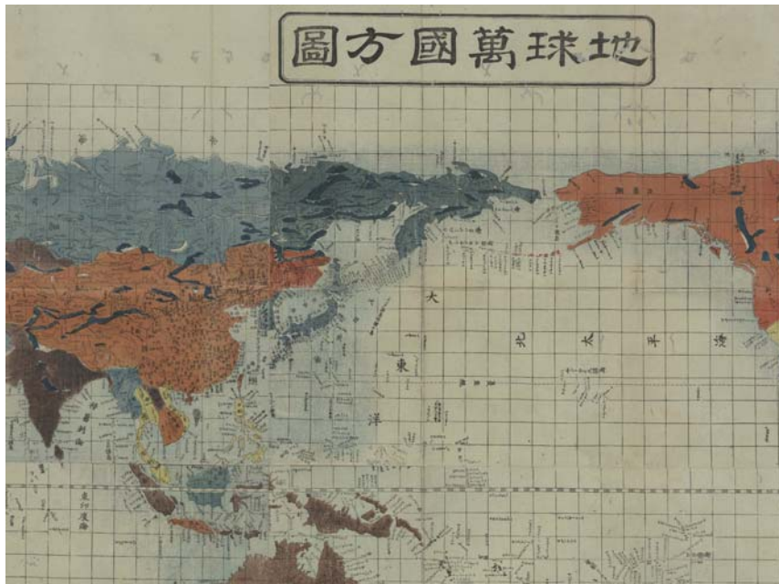
그림 2 1810년 천문관 고교경보(高橋景保)가 왕명을 받들어 제작한 신정만국전도 부분도

1844년에 기작성오(箕作省吾)가 만든 신제여지전도(新製輿地全圖)에서도 조선해라고 표기했고, 1850년에는 고교경보의 제자인 안전뇌주(安田雷州)가 만든 본방서북변계약도(本邦西北邊界略圖)에서도 일본해 대신 조선해라고 뚜렷히 표기하였는데 이들 지도들을 고교경보의 전통을 잇는 일본의 공식지도였다.