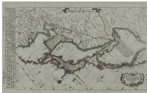
그림 4 1850년 안전뇌주(安田雷州)가 만든 본방서북변계약도(本邦西北邊界略圖)

그 후 1862년에 광뢰보암(廣瀨保庵)이 만든 환해항로신도(環海航路新圖)에서도 조선해라고 표기하였다.