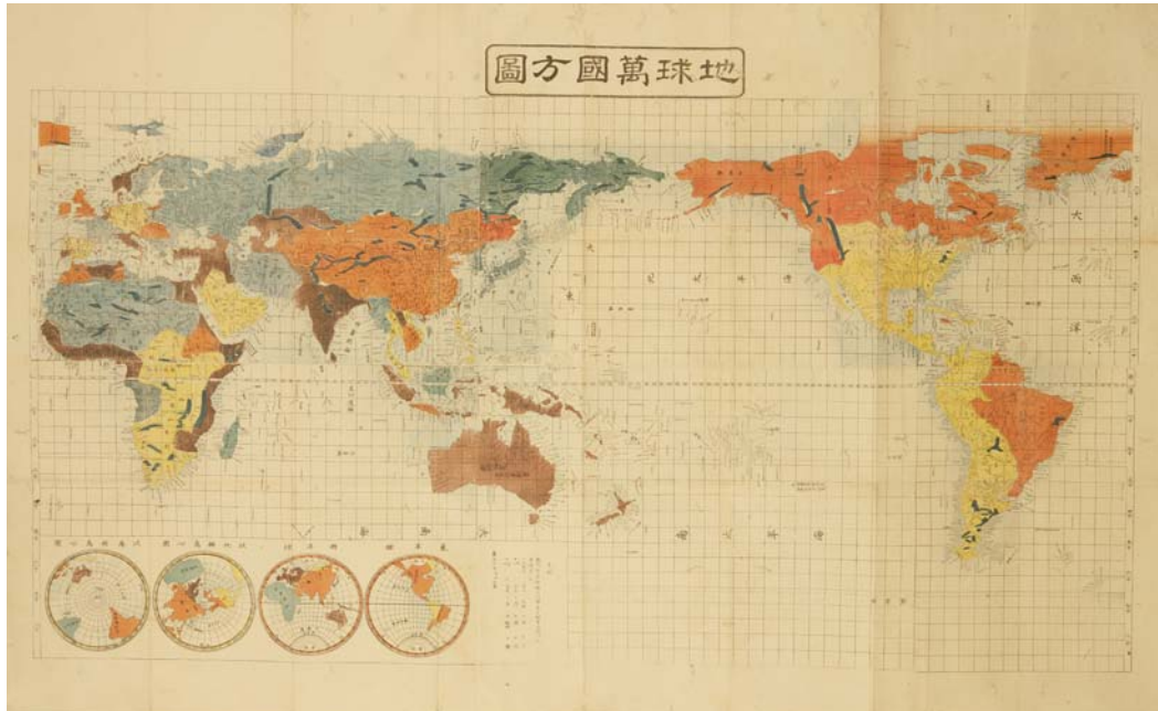
그림 6 1853년 취평당에서 제작한 지구만방도

그 외에도 1853년에 취평당에서 발행한 지구만국방도와 1865년에 현현당에서 간행한 동전대일본국세도에서도 조선해라고 표시하였으며, 1882년 무전승차량이 간행한 대일본조선팔도지나삼국전도에서 조선해라고 적었다. 이러한 사실은 19세기 후반기까지도 일본은 동해를 일본해가 아닌 조선해라고 표기하였음을 알 수 있다.